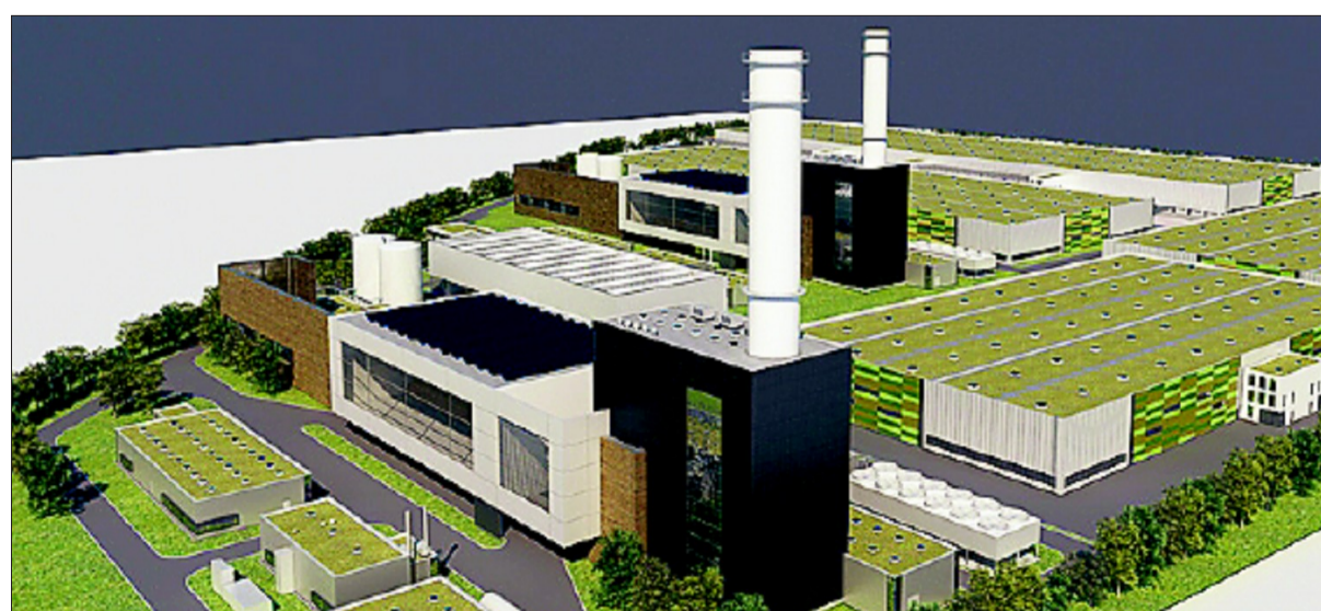
Für den BUND ist ein GuD (hier eine Ansicht der geplanten Böblinger Anlage mit zwei Linien) moderne Energietechnologie

Abschließend fordert der BUND eine ehrliche und offene Information über die Detailplanungen und Gutachten. „Die Anlage darf erst gebaut werden, wenn alle umweltrelevanten Sachverhalte prüffähig vorliegen und nachgewiesen ist, dass keine Verschlechterung der heutigen Situation eintreten kann“, schreiben die Umwelt-Aktivisten.